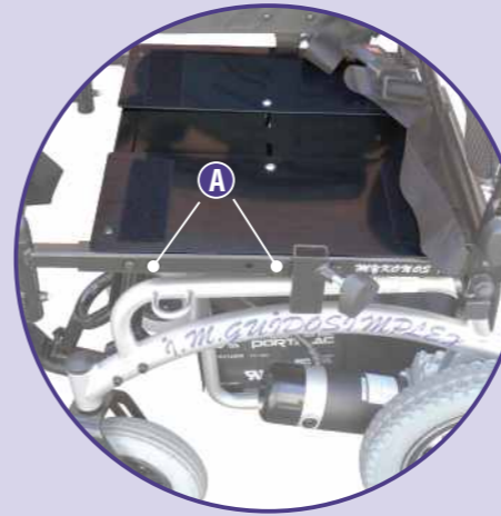
A. Sistemas graduación asiento