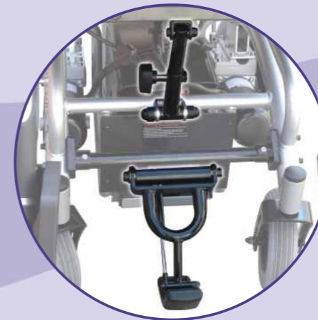
Sistemas de basculación asiento manual Sube bordillos